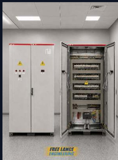
РАСПРЕД. ПАНЕЛЬ 250 А · 0.4 КВ