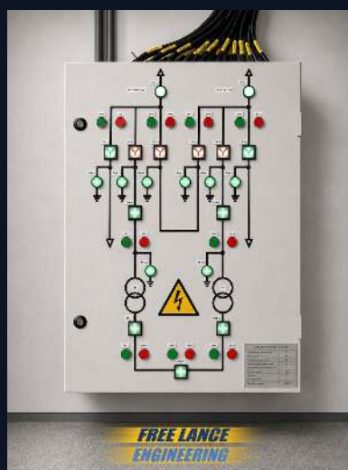
РУ-10 КВ · МНЕМОСХЕМА