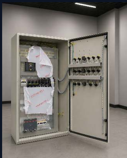
ЗАЩИТА ДВИГАТЕЛЬНОЙ НАГРУЗКИ

Шкафы управления нагрузкой, насосами и корпуса для агрессивных сред.