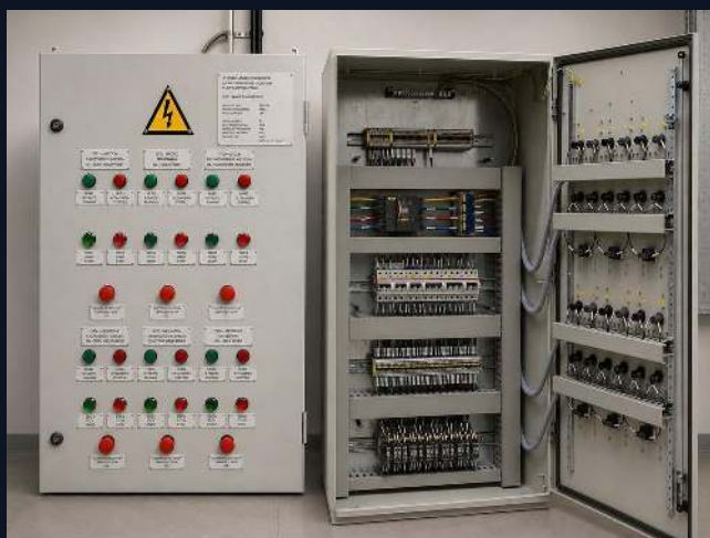
ДВЕ ПАНЕЛИ LDB

Главные распределительные щиты, щиты освещения и розеток, HVAC и PDB.