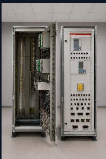
ОРУ-110 КВ · ABB IS2

Терминалы ABB REF / RET / REM серии 615, REX640.