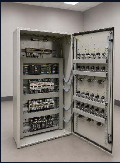
МОНТАЖ · АППАРАТЫ АВВ

Чёткая маркировка кабелей, аккуратные клеммные ряды, разводка по DIN-рейкам.