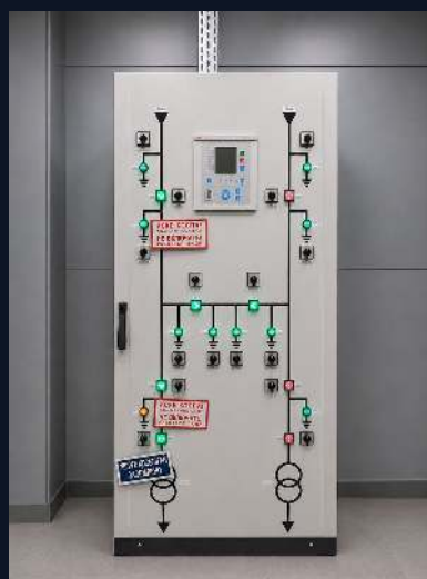
ОРУ-35 КВ · ПС JTI