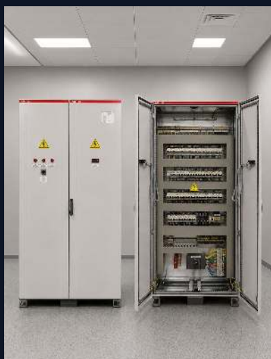
РАСПРЕД. ПАНЕЛЬ 250 А · ТШО