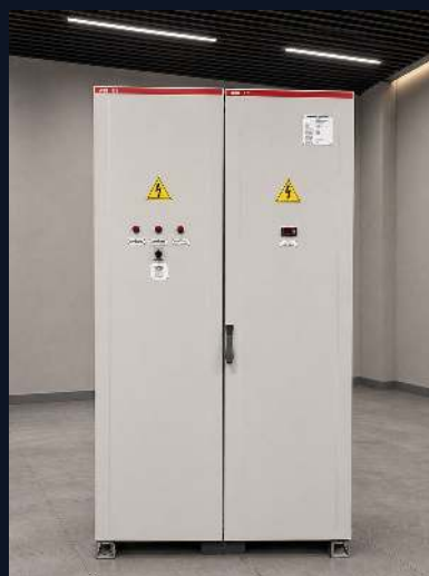
POWER DISTRIBUTION BOARD 250 A