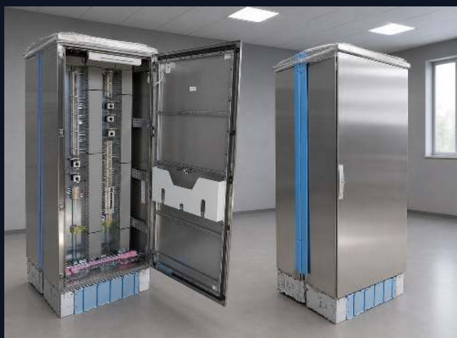
ШКАФ ИЗ НЕРЖАВЕЙКИ · 2-СТОП.