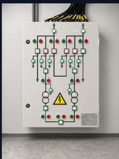
РУ-10 КВ · 630 А