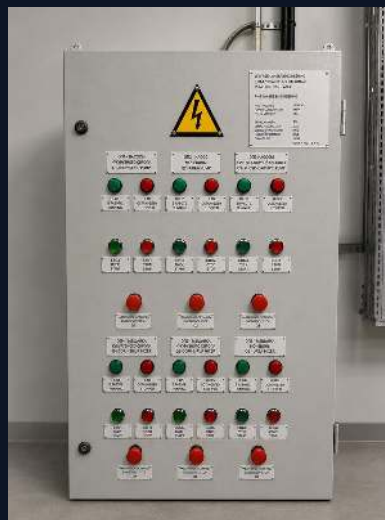
УПРАВЛЕНИЕ НАСОСАМИ · 0.4 КВ