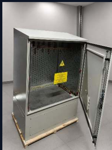
JUNCTION BOX · 10 КВ